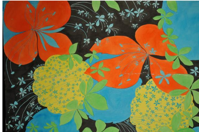
Ursula Klapper: Ein Entwurf große bunte Blumen auf Schwarz, 1969

Das Grassi Museum für Angewandte Kunst feiert in diesem Jahr sein 150-jähriges Bestehen und blickt auf eine bewegte Sammlungsgeschichte zurück. Dieser möchten wir mit unserer Aktion „150 Objekte“ mehr Sichtbarkeit verleihen. Gleichzeitig soll die Aktion Raum für Partizipation bieten. Die Kuratorinnen und Kuratoren des Hauses haben aus jedem der letzten 150 Jahre ein angekauftes Objekt dazu ausgewählt. Diese Objekte werden gebündelt über das Jahr verteilt auf der Website des Museums veröffentlicht.