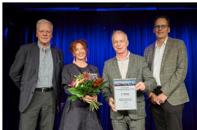
Preisverleihung Leipziger Tourismuspreis 2023

Wesentliche Punkte der Begründung waren die außerordentlich hohe Kompetenz des Museumsteams, dessen Engagement und die Aufgeschlossenheit für die Bewältigung auch sehr komplexer Aufgabenstellungen. Die Ausstrahlung innerhalb der Stadt Leipzig und weit über die Grenzen unserer Region und unseres Landes hinaus regt Kunstinteressierte national und international an, unsere Stadt zu besuchen.