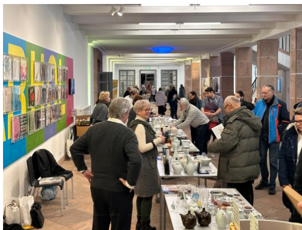
„Design zu haben“ am 5. Februar 2023

Bei der Einteilung der Personen für Verkauf, Kassierung und Verpackung unserer Verkaufsaktion werden Wünsche zur Teilnahme an parallel stattfindenden Veranstaltungen berücksichtigt.