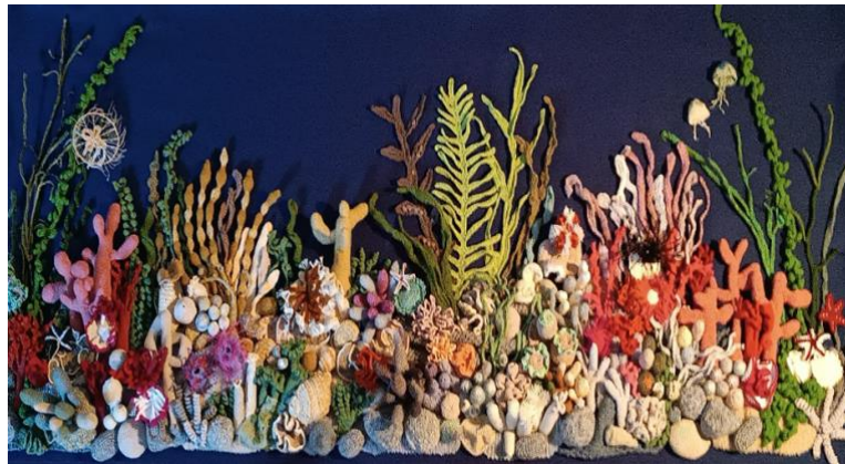
Arbeitsstand 02/2024 UNTERWASSERWELTEN

Wie auf der Abbildung zu sehen, haben wir die Grundfläche der Textilarbeit auf das Format 200x90 cm erweitert, sodass die Elemente spannungsreich angeordnet werden können. Diese wurden räumlich wirkend aufgelegt, um eine in sich bewegte Assemblage entstehen zu lassen.